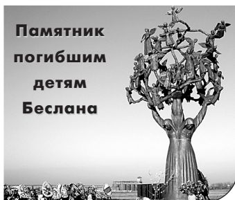
Памятник погибшим детям Беслана

Так почему же террористов называют словом «нелюди»?