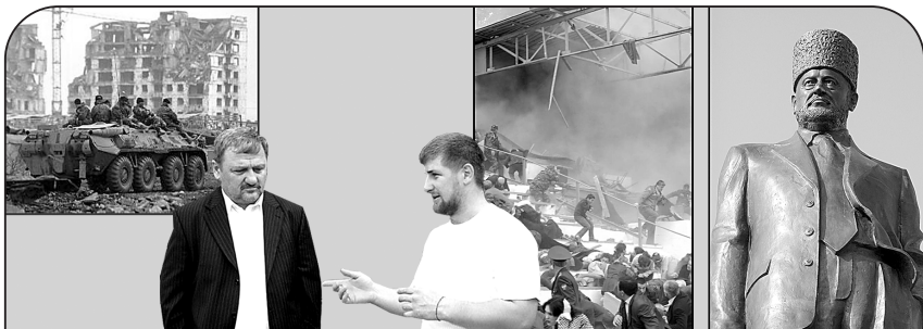
Так выглядел Грозный в 1995 году

И Ахмад Кадыров в 2004 году был убит террористами во время праздничного парада ко Дню Победы на стадионе в Грозном. За что? Он срывал их планы.