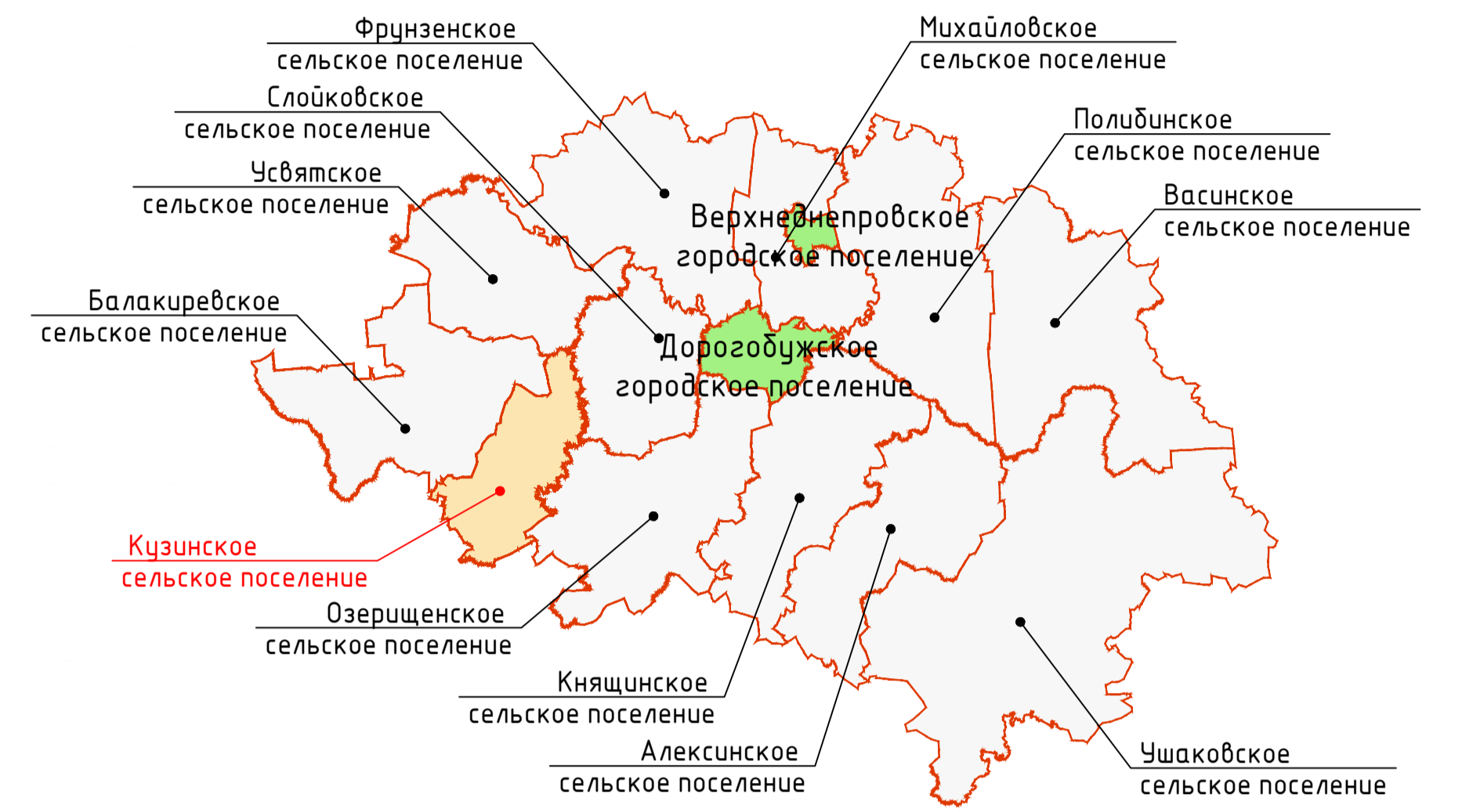
Схема расположения Кузинского сельского поселения в Дорогобужском районе Смоленской области