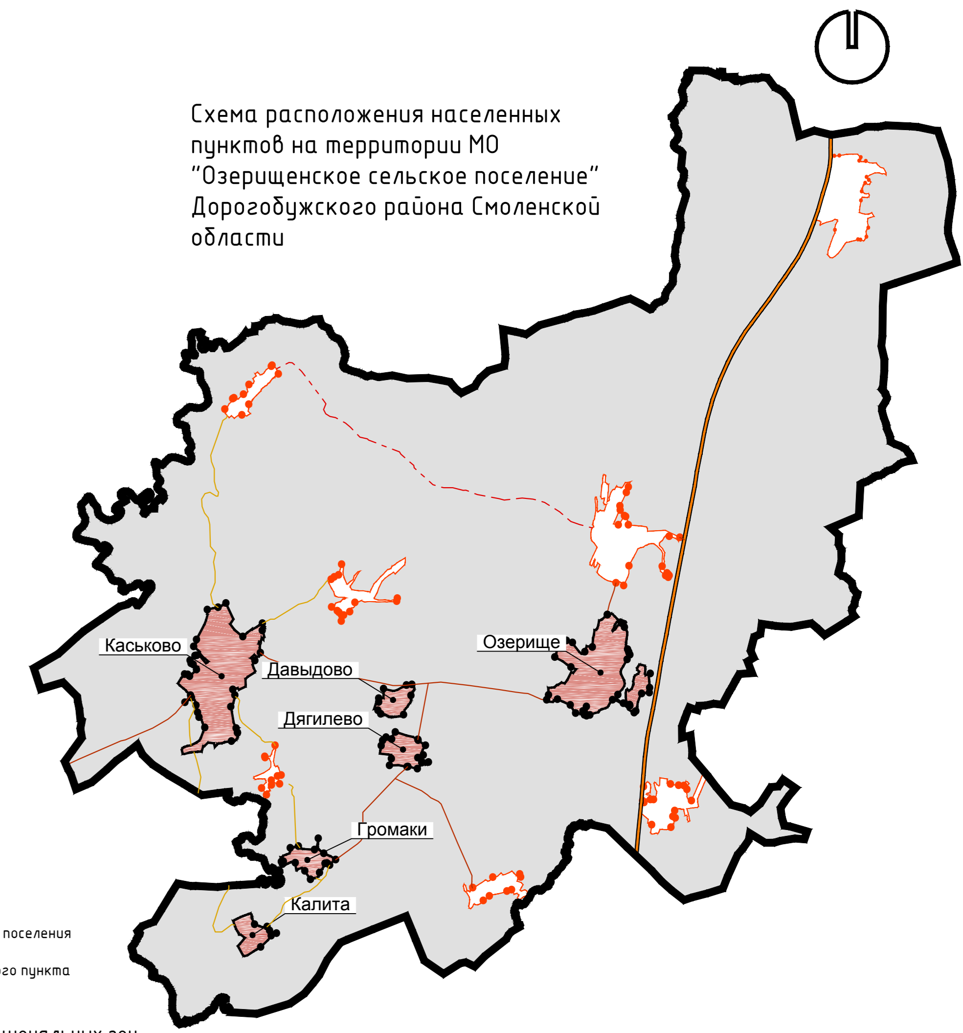
Схема расположения населенных пунктов на территории МО "Озерищенское сельское поселение" Дорогобужского района Смоленской области

Карта функциональных зон д. Озерище, д. Громаки, д. Давыдово, д. Дягилево, д. Каськово, д. Калима. М 1:5000.