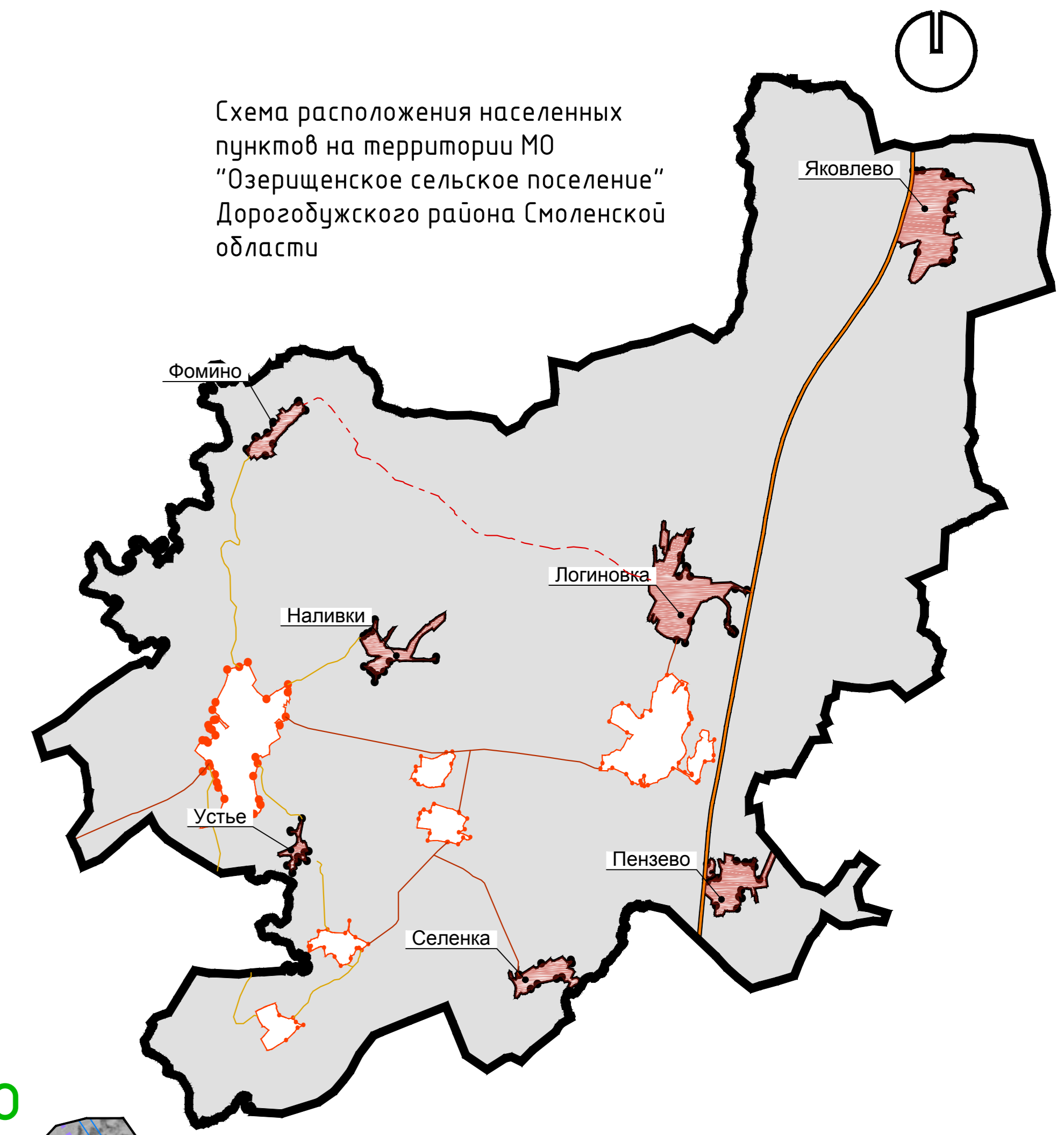
Схема расположения населенных пунктов на территории МО "Озерищенское сельское поселение" Дорогобужского района Смоленской области

Карта функциональных зон д. Яковлево, д. Логиновка, д. Наливки, д. Пензево, д. Селенка, д. Устье, д. Фомино. М 1:5000.