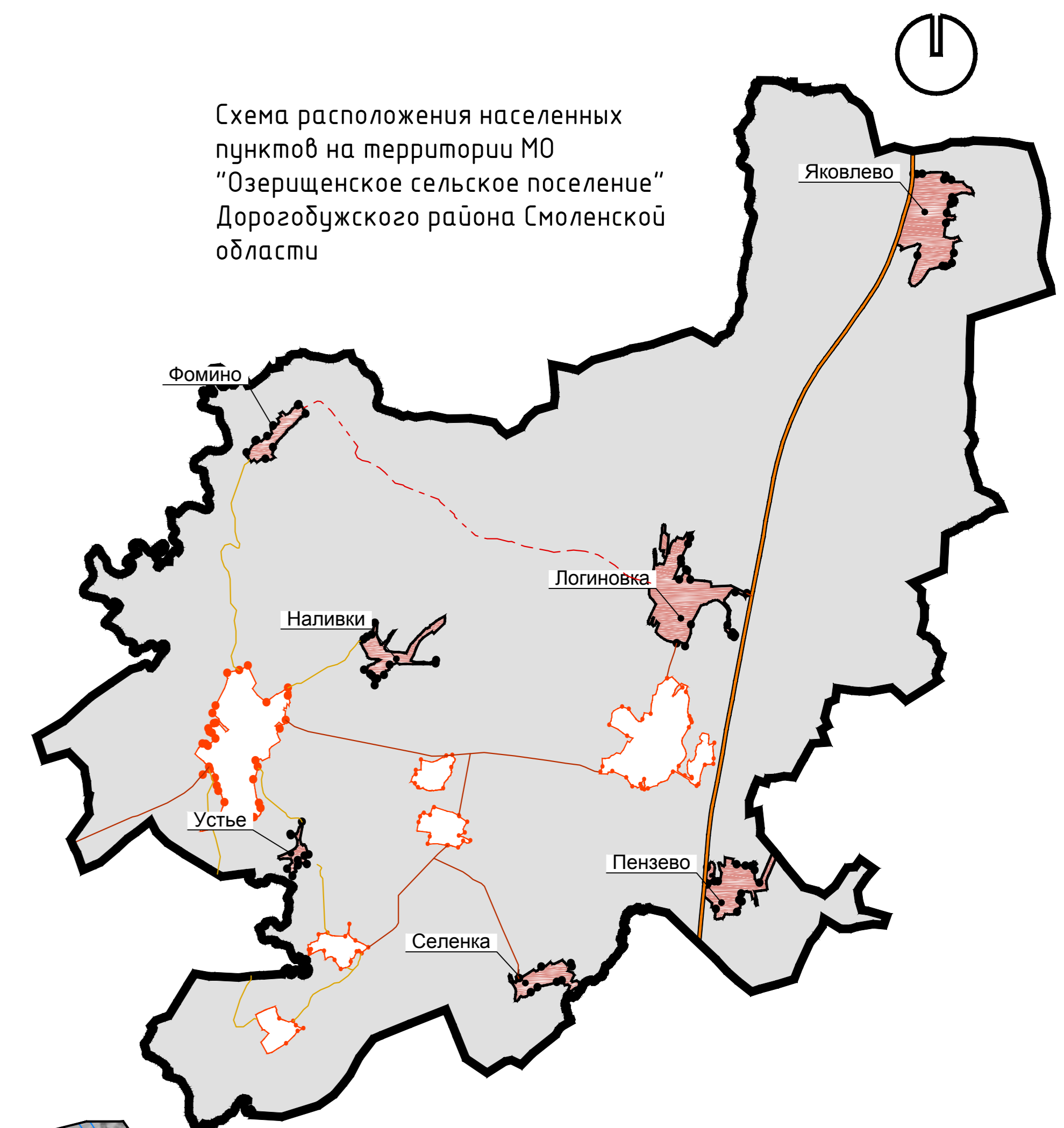
Схема расположения населенных пунктов на территории МО "Озерищенское сельское поселение" Дорогобужского района Смоленской области

Карта планируемого размещения объектов водоснабжения и водоотведения. М 1:5000.