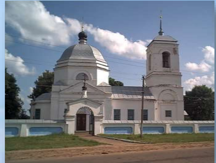
Церковь Святых первоверховных апостолов Петра и Павла