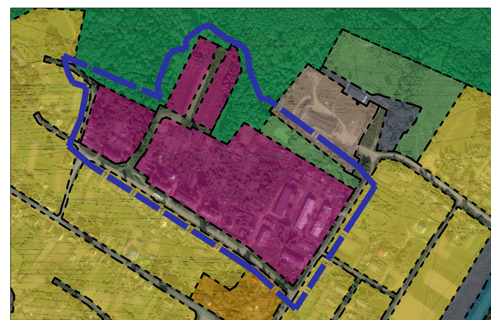
Фрагмент карты планировочной структуры территории городского округа с отображением границ элементов планировочной структуры. М 1:10000.