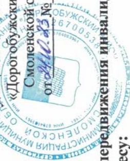
Схема размещения земельных участков для размещения гаражей, являющихся некапитальными сооружениями, и мест стоянки технических или других средств передвижения инвалидов вблизи их места жительства на земельном участке, расположенном по адресу:

Российская Федерация, Смоленская область, Дорогобужский муниципальный район, город Дорогобуж, улица Калинина